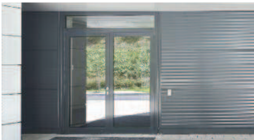
Schüco Porte ADS 60 Schüco Door ADS 60